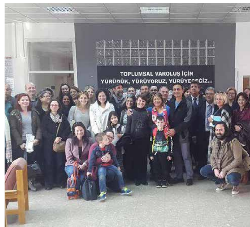
Επισκέψεις σε τ/κ σχολεία από Ε/κ εκπαιδευτικούς, 29 Δεκεμβρίου 2015